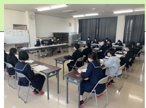
自分たちの力で、 学校や地域を創り上げよう

☆中学生ならではの取組で地域を活性化☆ ～2年生の探究学習～ コミュニティ・スクールを活用して、地域の活動とタイアップしながら、「自分たちの力で地域を盛り上げよう！」と総合(探究)学習に取り組んでいます。今後の社会の担い手となる生徒たちが、自分事として捉え、協働的・創造的に取り組んだ社会経験が、地域の人に喜ばれ、地域の活性化につながることを知る貴重な体験となっています。