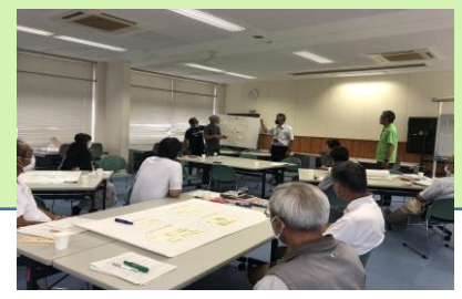
コミュニティ・スクールで WIN-WINの関係づくり

☆「支援のための組織づくり」☆ 淀江中学校区は、コミュニティ・スクール2年目を迎え、活動も充実してきました。これまでの活動を整理しながら、さらに地域でできることについて学校運営協議会で熟議を行い、ボランティア組織づくりを進めています。 ☆淀江町内の事業所インタビュー 「地域を知ること、地域の可能性を考える」☆ ～中学校2年生校外学習～ 淀江中学校のコミュニティ・スクール推進員・教員・生徒がリストアップした63社の町内事業所を、2年生21グループが訪問してインタビューしました。