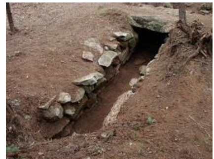
上ノ山古墳・石室（淀江地区）

埋蔵文化財は、ほぼすべての地区に所在しますが、古墳等は平野に面する丘陵地が広がる尚徳・成美地区などの南部地域、大高・県地区などの箕蚊屋地域、宇田川・大和地区などの淀江地域に集中して分布しています。このうち前方後円墳については、全国的な集成により旧米子市 24 基、旧淀江町 26 基が記録されており、旧淀江町域における分布の濃さが顕著です。一方、中心市街地には博労町遺跡などの集落遺跡が、沖積平野の低湿地・砂丘地に埋没していることが知られています。また、近世以降に開拓が進んだ弓浜地域には、埋蔵文化財包蔵地はほとんど見られません。