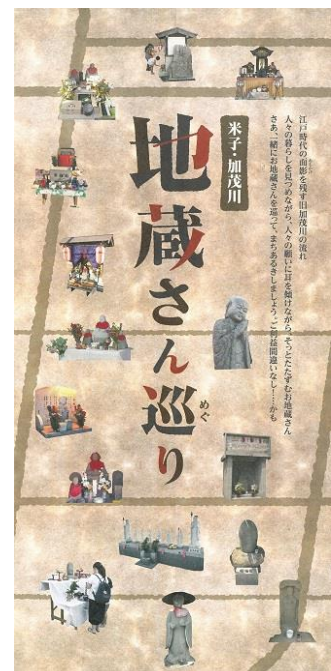
米子加茂川地藏さん巡り

また、生活文化に関わる文化財のうち地域に特有の食文化としては、大山おこわ・大山そば以外にも、郷土料理「イタダキ（通称ノコ飯）」が文化庁の推進する「100年フード～明治・大正に生み出された食文化」に認定されています。