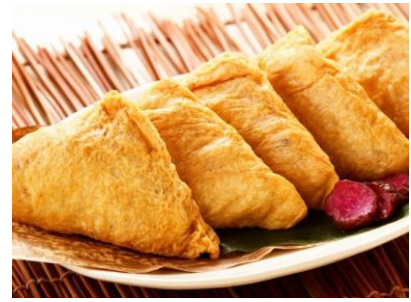
100年フード・イタダキ

※88とは「米」の字を「八十八」に解体したもので、米子の地名の謂れとされているものです。