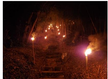
セントロマントロ

遺跡（史跡）としては中心市街地に旧城下町を構成する出雲街道と中筋から派生する路地を当地方では「小路」と呼び、懐かしい佇まいを見せています。また、米子は水にも恵まれ、旧城下町には宮水などの名水井戸が知られており、眞名井の