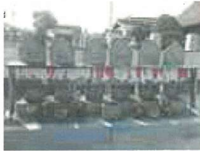
安国寺の六地藏 寺町 平和祈願