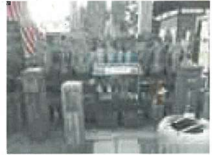
法蔵寺の地藏 (味噌なめ地藏) 寺町 イボとり祈願