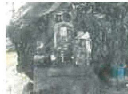
清洞寺岩地藏西町 平和祈願