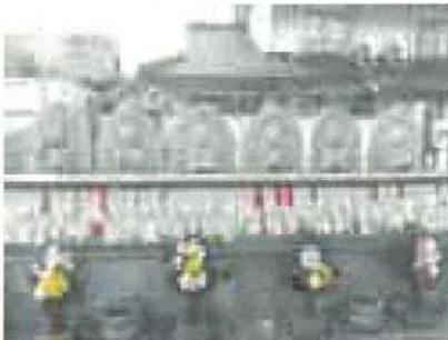
瑞仙寺の六地藏 寺町 若返り祈願