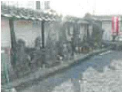
心光寺の地藏 寺町