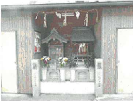
塩町地藏 (塩町大師堂) 塩町