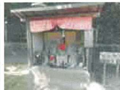
城山大師の地藏 久米町

その他に、 総泉寺の味噌なめ地藏 (愛宕町) 木毛の地藏 (富士見町) 廃寺跡の地藏 (博労町三丁目) 光西寺の地藏 (博労町一丁目) 水雷の水子地藏 (久米町) 了春寺の地藏 (博労町二丁目) 法城寺の地藏 (博労町二丁目) などがある。