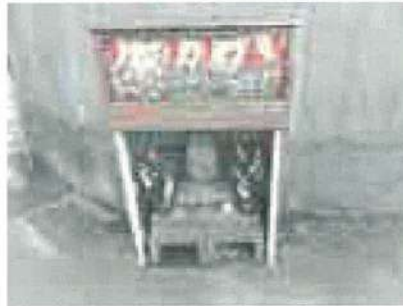
与太郎地藏 立町1丁目