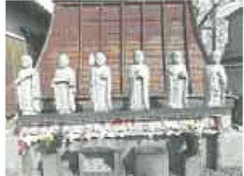
福蔵院六地藏 寺町 幸福祈願