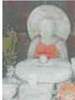
寺町地藏 (北向き地藏) 尾高町 開運祈願