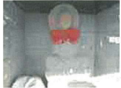
みなと地藏 灘町二丁目 児護祈願