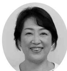
や た が い か お り 矢田貝 香織 議員 【公明党議員団】

■福祉保健部長 総合相談支援センターえしこに設置した。センターは、相談支援だけでなく、当事者との信頼関係を構築しながら、就労に必要な知識・技能の習得や社会参加、自己実現の機会をサポートすることも重要な役割である。今後、就労支援の充実のため、庁内関係部局、関係機関や支援団体等とより緊密に連携し、協議していきたい。