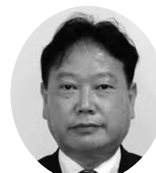
とくだ ひろふみ 議員 徳田 博文 信風

■市長 本市は補助対象業種の 範囲を拡充し、広くICTを含 む情報関連企業へ、支援を行う 姿勢を打ち出している。今後も その時々の経済情勢や、ニーズ を見つつタイムリーな支援を行 うことで、ICTを含む情報関 連企業の進出、業容拡大につな げたいと考える。