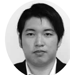
もりたしろ 森田悟史 議員 【無所属】