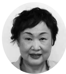
いましろ まさこ 今城 雅子 議員 【公明党議員団】