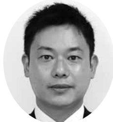
おくいわ ひろき 議員 奥岩 浩基 【自由創政】