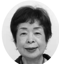
にしこおり ようこ 錦織 陽子 議員 【日本共産党米子市議団】