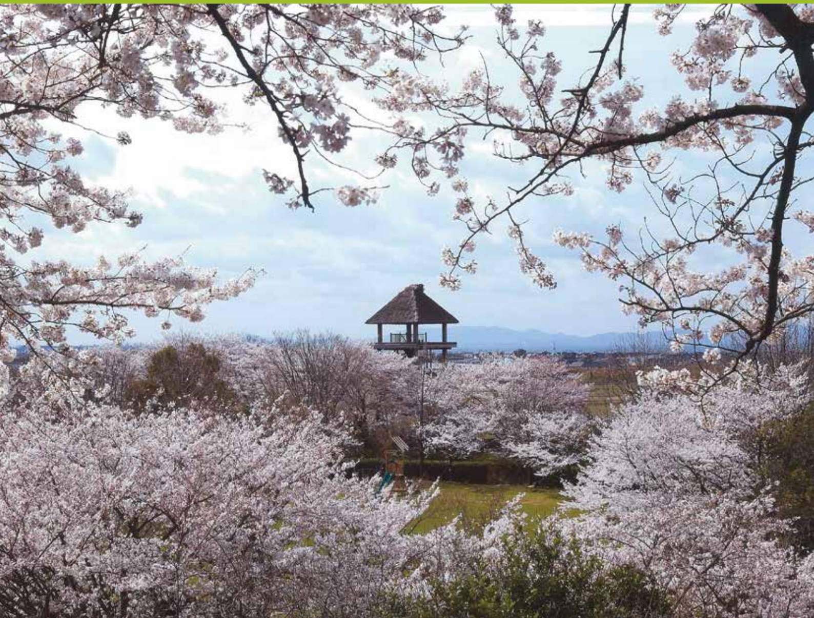
表紙写真「満開の桜に包まれて」