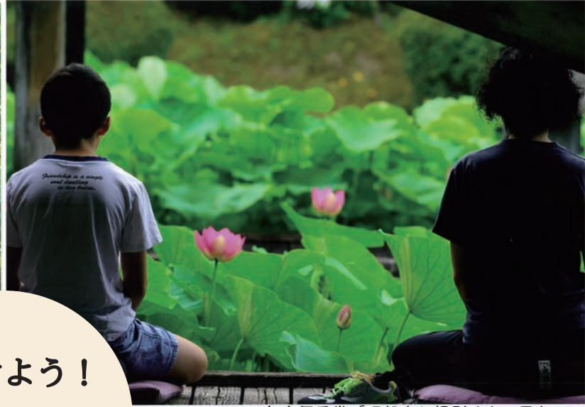
2021年度優秀賞「瞑想中」撮影場所/伯耆古代の丘公園