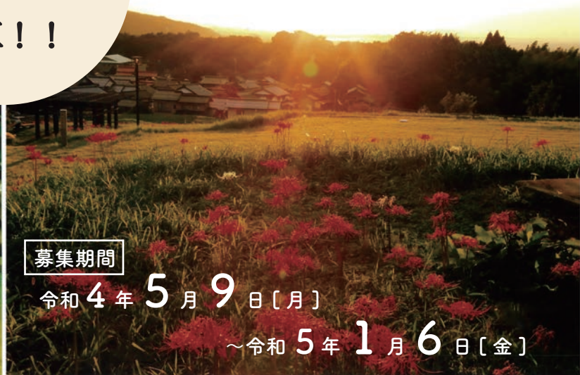
2021年度優秀賞「夕景に燃える」撮影/田中正義 撮影場所/国史跡上淀廃寺跡