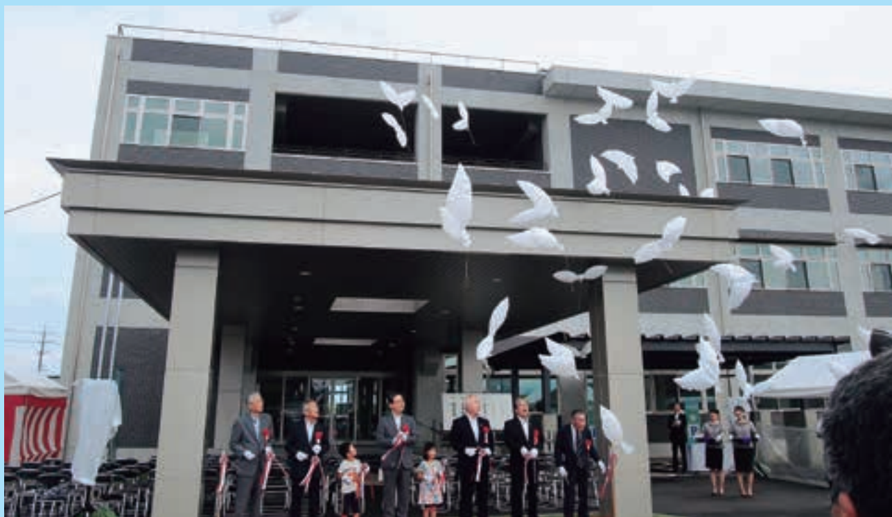
平成29年6月定例会の あらまし

● 定例会のあらまし…………… P1・2 ● 委員会構成…………… P2 ● 意見書…………… P3 ● 米子市議会議員政治倫理条例の検証に 関する中間報告…………… P3・4 ● 市政一般に対する代表質問…………… P5～20 ● 市政一般に対する質問…………… P21～23 ● 議案等審議結果一覧表…………… P24・25 ● 9月定例会の日程…………… P26 ● 政務活動費領収書等の公開について P26