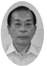
えんどう とおる 遠藤 通議員