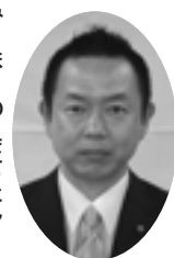
みつほのまさとし 三穂野雅俊議員

■議員 本市では、農業法人や大規模農家において、就労者不足が深刻となっている。農業特区制度を導入し、外国人労働者を受け入れ、労働力不足を解消することで、荒廃農地の減少にも弾みがつくと考える。各都道府県や市町村でも特区認定に向けた動きが活発になっているが、本市の今後の計画について伺う。 ■市長 県の指導により、今月末をめどに本市と境港市の共同で特区の提案書をまとめているところである。準備が整い次第、提出したいと考えている。