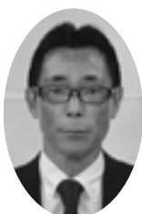
わたなべ しょうじ 渡辺 穰議員