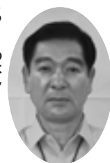
やたくら くにひろ 矢倉 強 議員 (華胥)

○健康で文化的な最低限度の生活を保障する生活保護行政について ○市民に開かれた市政にするための情報公開のあり方について