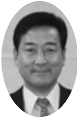
たむらけんすけ 田村謙介 議員