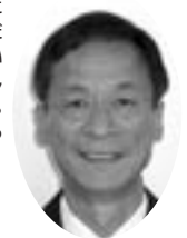
杉谷第士郎 議員(コモンズ)