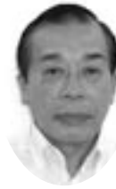
遠藤 通 議員(一院クラブ)

教育委員会事務局長 重油から変更を行う場合、地下埋設タンクの除去等の高騰が否めない。既存設備の復旧、ボイラーの更新等を行い、燃焼効率の向上を図るとともに、室内の保温性に配慮するなどCO2排出量の削減に努めていく。 (その他の質問項目) 教育委員会所管の施設整備について