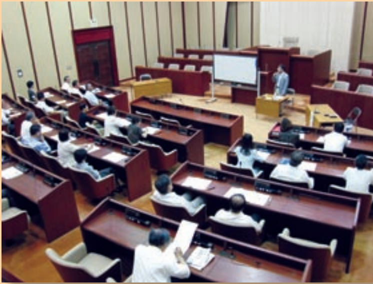
平成23年度米子市議会議員研修会のようす (議会基本条例について)