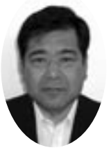
安田 篤 議員(公明党)