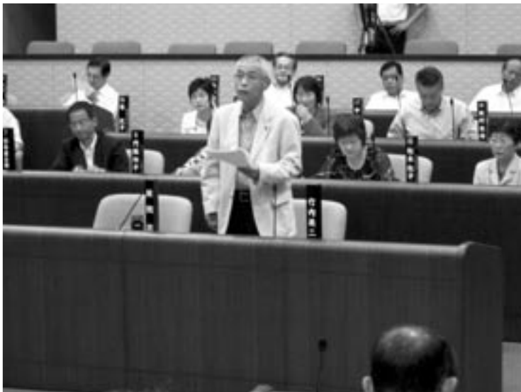
質問席からの質問のようす

これにより、市政一般に対する質問を行う際は市長等執行部と対面しながらの論戦となり、活発な議論が繰り上げられるようになりました。