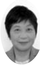
いしはら よしえ 石橋佳枝 議員 日本共産党 米子市議 会議員団