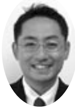
まつだ たかし 松田 正 議員(蒼生会)