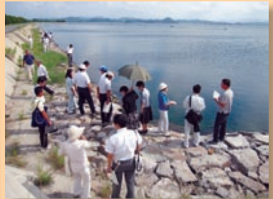
中海に係る現地視察のようす