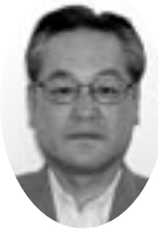
安木達哉 議員(公明党)