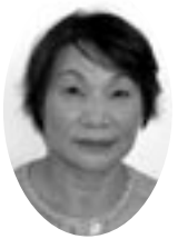
かさやえつこ 笠谷悦子 議員 (公明党) (議員団)