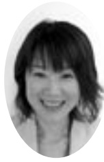
やまかわ ともこ 山川智帆 議員(虹)

から、わがができる楽しさや喜びを味わうために受け身の指導基本動作、基本となるわざを用いて投げたり押さえたりするなどの攻防を展開するという手順を徹底して指導を進め、事故防止に努めてきた。引き続き安全に配慮しながら学習が進められるよう努めていきたい。