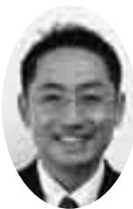
松田 正 議員