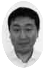
くにとう 国頭 靖 議員