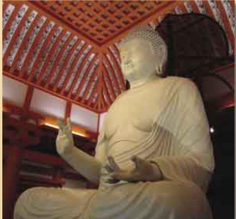
平成23年4月24日に開館した上淀白鳳の丘展示館