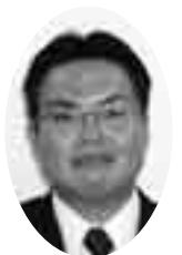
稲田 清 議員