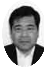
安田 篤 議員

教育長 スキンシップを行うことにより、子どもたちの不安やストレスを軽くすることができ、効果があると聞いている。どういう形で学校に取り入れることができるか、どういうふうに使えるものか、これから研究してみたい。