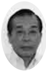
えんどう 遠藤通議員(一院クラブ)