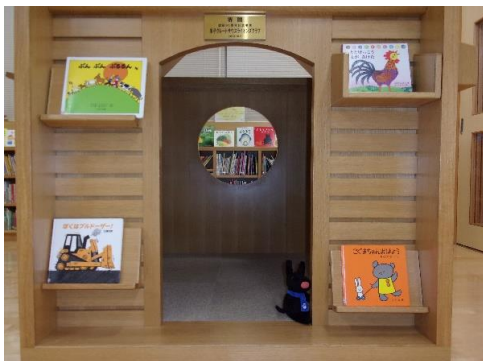
(ふつうのしゃしん)

よなぼんです！春になってほかほかい気持ち♪こんな日はじまんのカメラを持って、おでかけしたくなるなあ～。 なんとこのカメラ、とてもふしぎなカメラでしゃしんをとると、もう1まい、ふしぎなしゃしんが とれるんだ！下の2まいのしゃしんも、このカメラでとったしゃしんなんだけど、「ふつうのしゃしん」と 「ふしぎなしゃしん」でちがうところが5つあります。どこか分かるかな？ 「ふしぎなしゃしん」のちがうところに○をしてね！全問せいかいでめざせ！スタンプゲットだぜ！ レッツチャレンジ♪