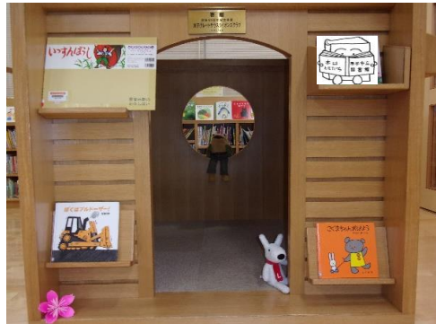
(ふしぎなしゃしん)