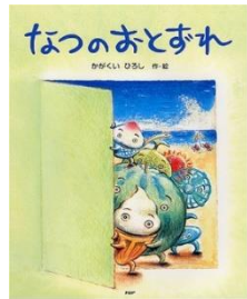
『なつのおとずれ』 かがくい ひろし // 作・絵 (PHP研究所)

「やったー! きょうはいちだんとい いてんき!」 でも、まどの外は大雨…。 さて、カエルのあべこべなピクニッ クのはじまりです! あめの日でもウキウキ楽しい気持ち になる本です。