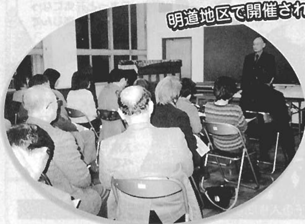
明道地区で開催された小地域懇談会の様子