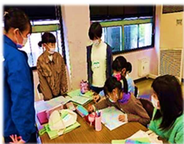
グループで話し合い

冬の雪山合宿に向け、リーダー研修生は初日と2日目にわかれ司会進行の挨拶や時間配分を決めています。大まかなスケジュールは大人が考え、雪遊びやウッドバーニング(ウッドクラフト)などやりたい事を話し合い決めていきます。