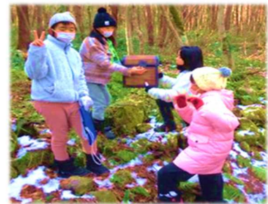
オリエンテーリング

この2日間で自然の山中での活動ができ、インリーダー達がよく話し合い、進行実施して仲間づくりができたことは大きな成長につながりました。体験活動は子どもの成長に欠くことのできないものです。ぜひインリーダー育成研修に参加してみてください♪