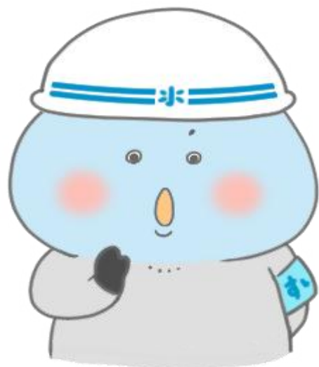
米子市上下水道局PRキャラクター パッキン☆マン