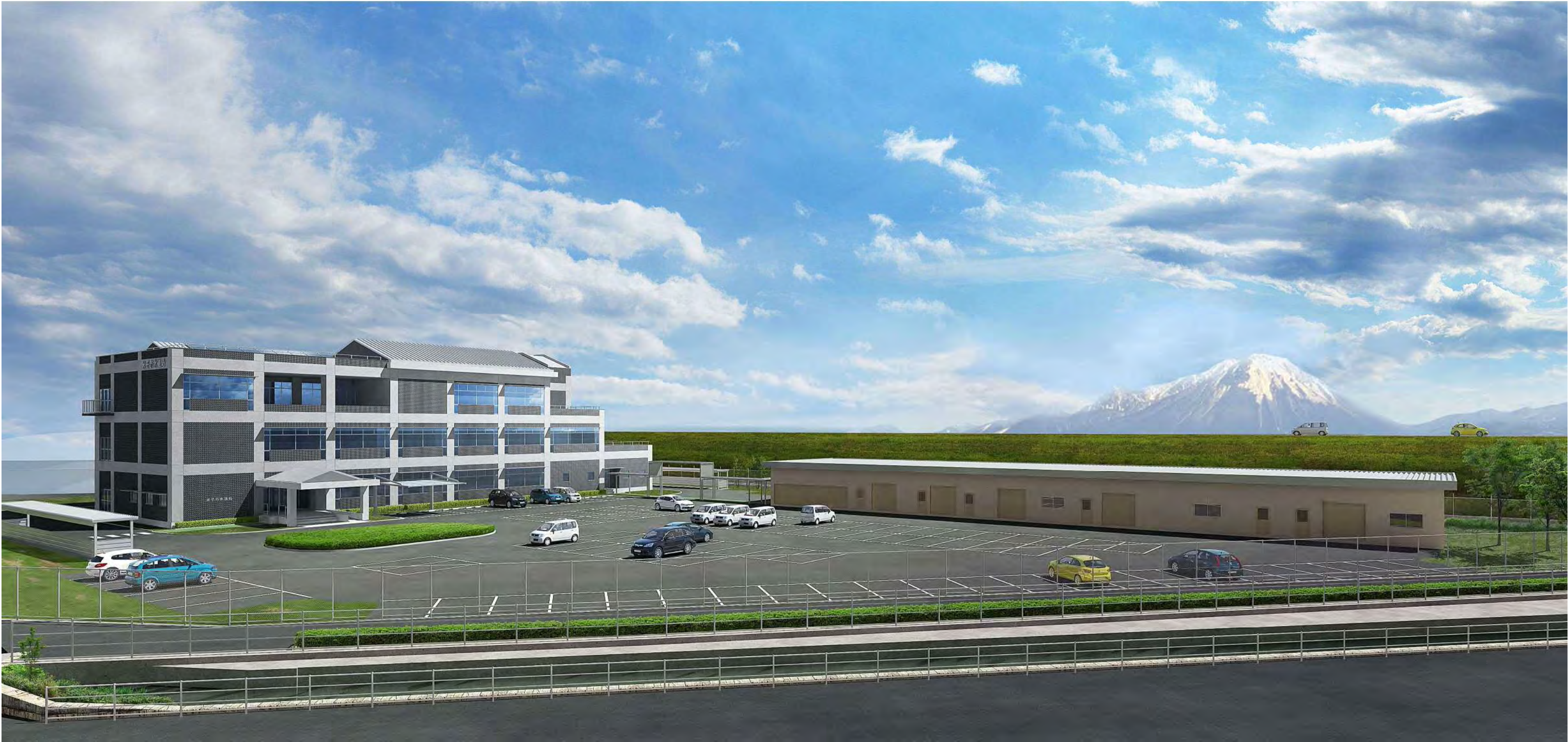
米子市水道局新庁舎