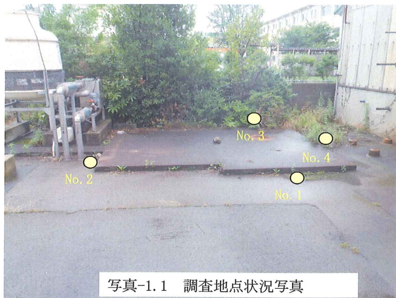
写真-1.1 調査地点状況写真