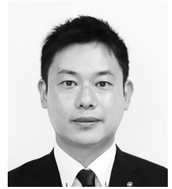
おくいわ ひろき 議員 奥岩 浩基 (蒼生会)