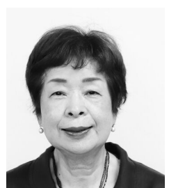
にしこり ようこ 議員 錦織 陽子 (日本共産党米子市議団)