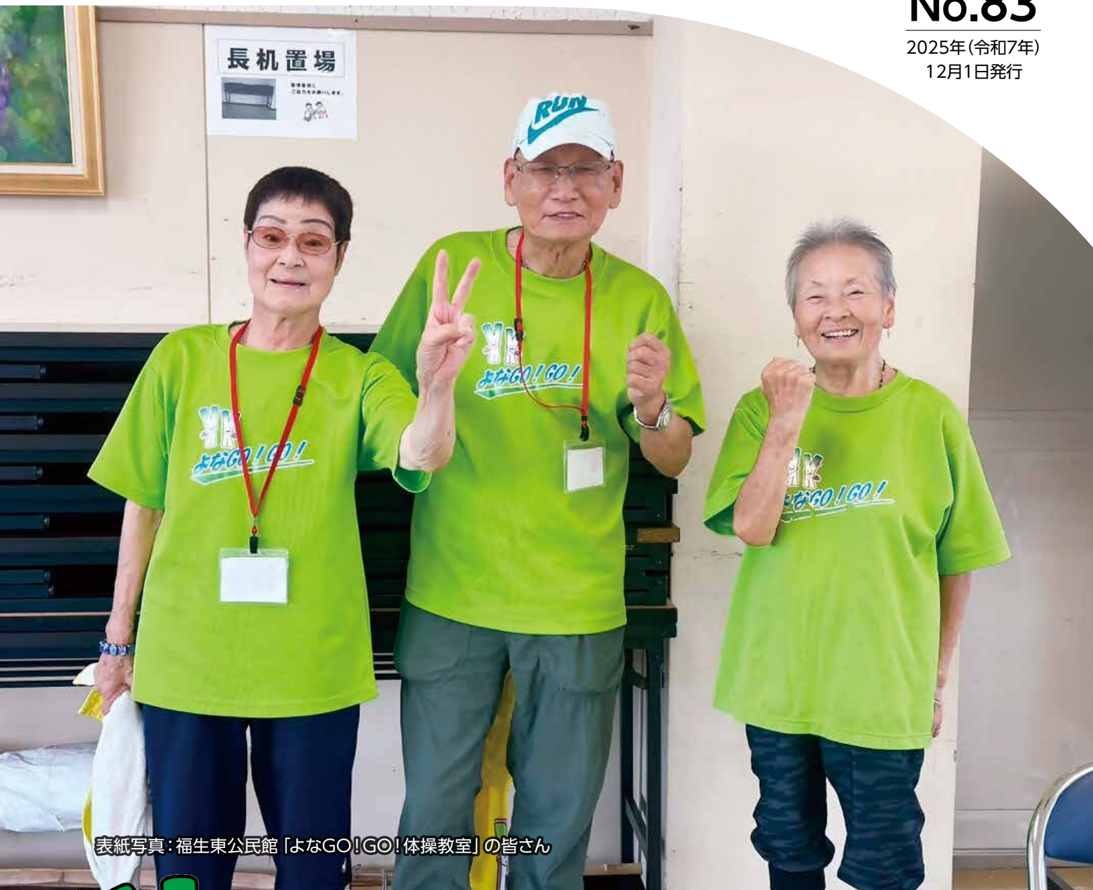
表紙写真: 福生東公民館「よなGO!GO!体操教室」の皆さん