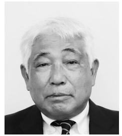
あだち たかし 議員 安達 卓是 (信風)