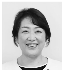
や た が い か お り 議員 矢田 貝香織 (公明党議員団)