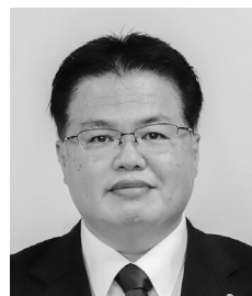
稲田 清 議員 (蒼生会)