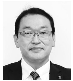
津田 幸一 議員 (公明党議員団)