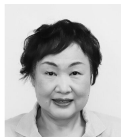
今城 雅子 議員 (公明党議員団)