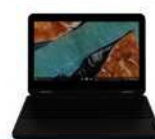
ラップトップモード