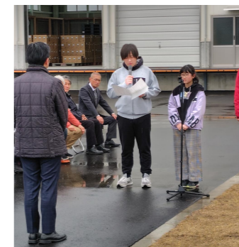
伊木市長へお礼の言葉

芝生広場は、淀江保育園跡地利用管理運営委員会を設置し今後の利用・管理方法などを決め、地域の憩いの場また防災活動の中心として有効に活用していきます。