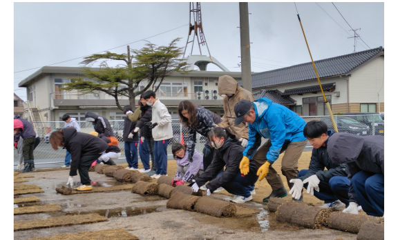
ロール状の芝生を敷き詰めました