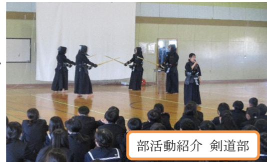
部活動紹介 剣道部

から26日(土)には、3年生は大阪・関西万博をはじめとする、修学旅行に出かけました。1・2年生もそれぞれ、学年行事を実施し、絆を深めるために、仲間づくり行事を実施しました。学校は教科学習以外にも、さまざまな活動をおこなう場所です。ここでしか体験できないことを大切にしつつ生徒の成長を見守り、支えていきたいと思っています。『縁』を感じながら、誰もが幸せに過ごせることを願っています。