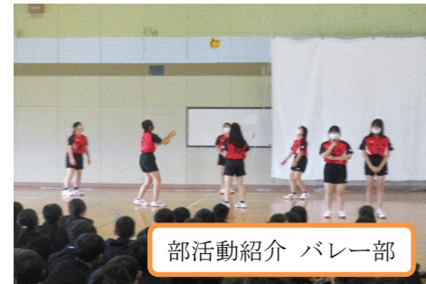
部活動紹介 バレー部

お手本となるべく、何事にも高い意識をもって取り組んでいます。また、部活動体験でも各部で多くの新入部員を迎え入れようと、いつも以上に張り切っている姿が見受けられます。