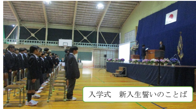
入学式 新入生誓いのことば

4月9日(水)の着任式では、13名の新しい先生方を迎え、その後1学期の始業式をおこないました。2・3年生にとっての新しいクラス、環境のスタートです。10日(木)には入学式で新入生を迎え、全校生徒429名での令和7年度が本格的に始動しました。新入生は、新生活に慣れるべく、日々の新しい経験・発見を楽しみつつ、多くのことを学んでいます。2・3年生は、後輩を迎え、