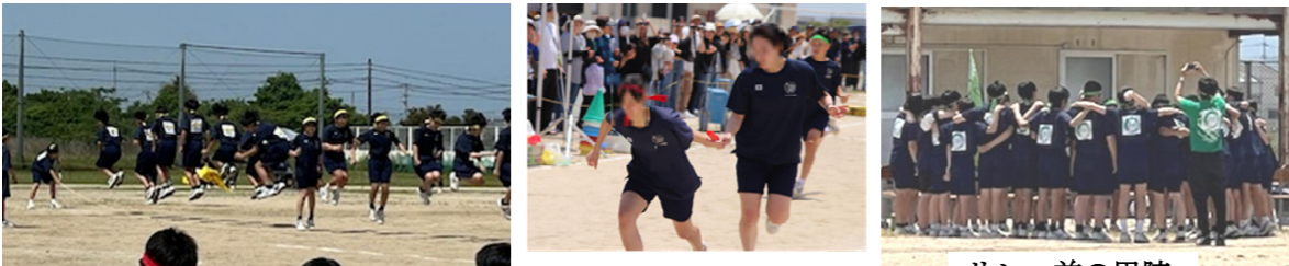
生徒会種目「大縄跳