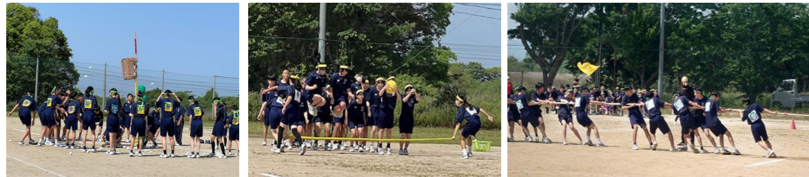
1年大run 投玉入れイチネンズ 2年 走るだけじゃダメですか?

体育祭当日は、クラスごとに円陣を組んで声を出し合っ心をついにしたり、自分のクラスだけでなく他のクラスや他学年の生徒にも惜しみなく応援をしたりする様子が見られました。特に3年生は、準備を一生懸命行ってきた自信がみなぎり、保護者の方からも「さすが3年生」という声が多く上がっていました。