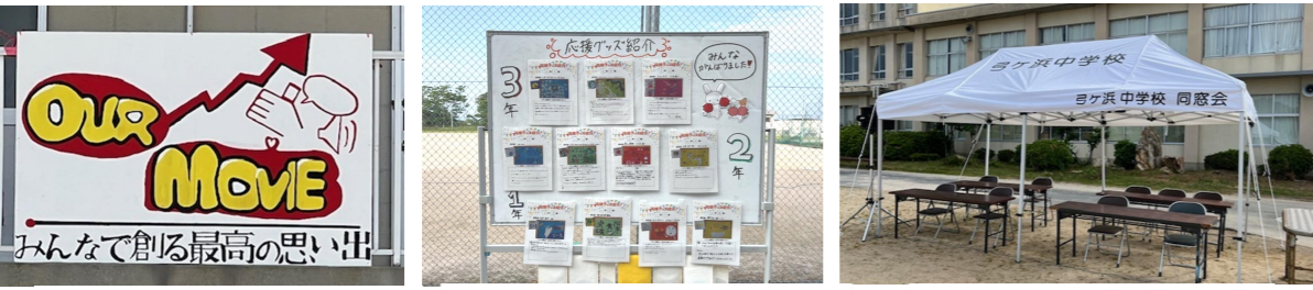
スローガン(美術部制作)

令和7年5月19日(月)に、第79回弓ヶ浜中学校体育祭を行いました。天候不良のため土・日の開催を見送り、平日の開催としました。生徒の活躍を楽しみにされていた方には大変申し訳なく思いますが、ご容赦いただきたいと思ひます。この日は天気にも恵まれ、最高の体育祭日和の中、みんなが全力を出し切り、競技を行うことができました。またこの度、同窓会よりテントを2張、寄贈していただき、体育祭ではじめて使わせていただきました。