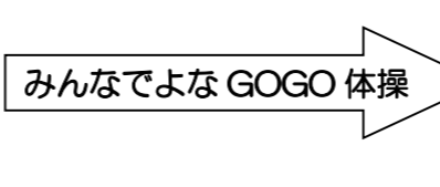
みんなでのな GOGO 体操