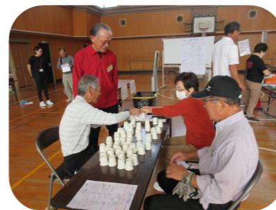
紙コップで宝探しゲーム

10月11日(土)に弓ヶ浜小学校体育館で【健康まつり】を開催しました。吹き矢ダーツ・輪投げ・ラダー運動など、13コーナーあり、参加者の皆さんは、身体を動かしたり笑ったりと、楽しい時間を過ごされていました。