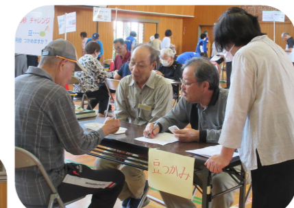
豆つかみコーナー