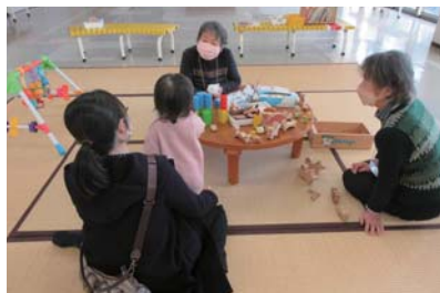
おしゃべり会の様子。元保育士の先生方が、優しく話を聞いてくださいます♪