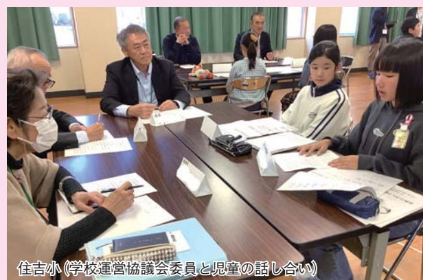
住吉小（学校運営協議会委員と児童の話し合い）

各校に設置されている「学校運営協議会」では、学校運営の基本方針の承認をはじめ、学校や子どもたちの状況を共有しながら、保護者・地域・学校の代表が継続的に熟議を重ねています。近年は、学校が抱える課題や子どもたちの思いをより深く理解するため、児童生徒や教職員も加わって話し合う取り組みも始まっています。話し合いの場では、地域の皆さんと児童生徒が自然と笑顔で言葉を交わし、和やかな雰囲気が生まれています。何気ない対話の積み重ねが、お互いを理解し合う貴重な時間となり、地域と学校のつながりをより一層深めています。