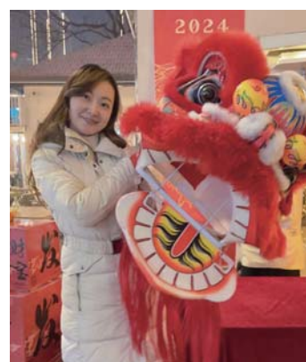
街の春節祭りを楽しむ