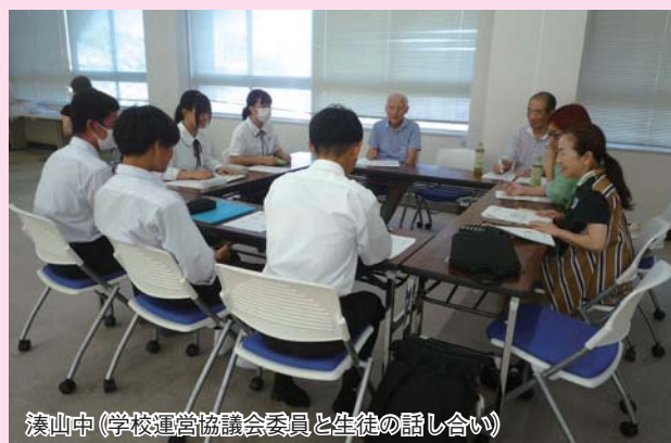
湊山中（学校運営協議会委員と生徒の話し合い）