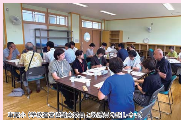
車尾小（学校運営協議会委員と教職員の話し合い）