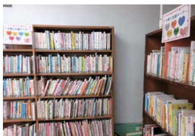
図書室には、育児に関する本もたくさんあります。ぜひご活用ください！

空気が乾き、気温も下がる冬は、ウイルスが生きやすくなり、免疫力も落ちやすい季節です。風邪やインフルエンザ、山陰では「腸感冒」と呼ばれる感染性胃腸炎などが流行しやすいです。近年は新型コロナウイルスも加わって、子どもの体調管理に悩まれるご家庭も多いのではないのでしょうか。