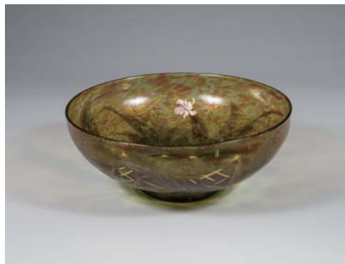
エミール・ガレ《エビネとメダカ文鉢》