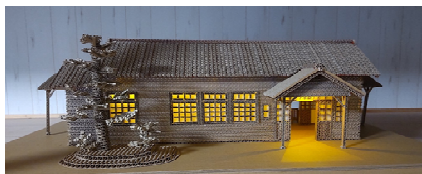
1903年(明治36年)開業の 「駅舎3兄弟」 「下市駅」