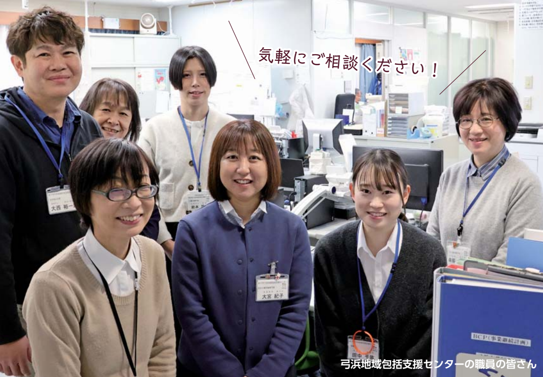
弓浜地域包括支援センターの職員の皆さん