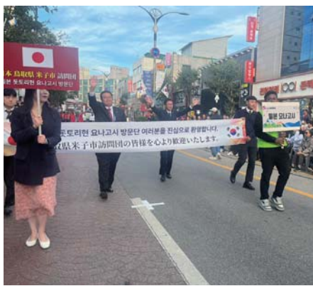
同じく文化祭のパレードに参加した伊木市長と稲田議長