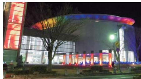
米子コンベンションセンター