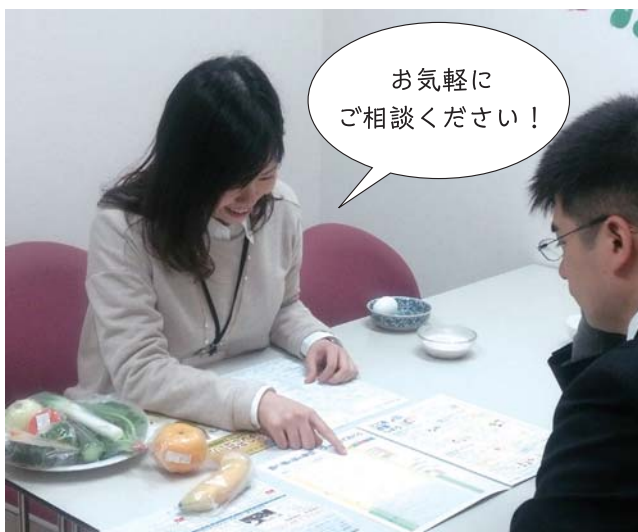
健康対策課 (☎ 23-5452 FAX 23-5460)

「成人健康相談（要予約）」や「保健師の出張！なんでも健康相談（予約不要）」など、保健師や管理栄養士が個別に健康づくりをサポートします。くわしくは市ホームページまたは健康対策課へお問い合わせください。