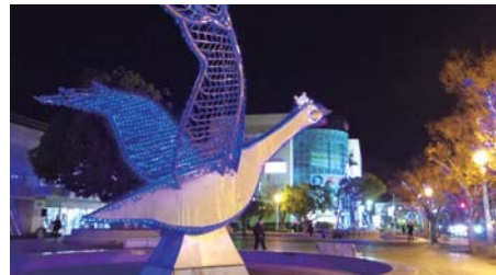
米子市文化ホール