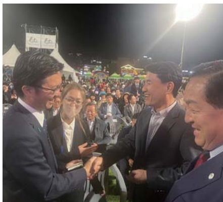
東草市昇格60周年記念式典には江原道知事も出席