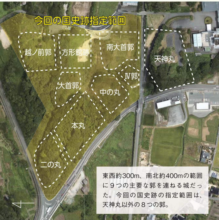
東西約300m、南北約400mの範囲に9つの主要な郭を連ねる城だった。今回の国史跡の指定範囲は、天神丸以外の8つの郭。