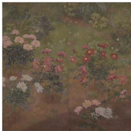
香田勝太《猫と芍薬》制作年不詳 油彩・絹