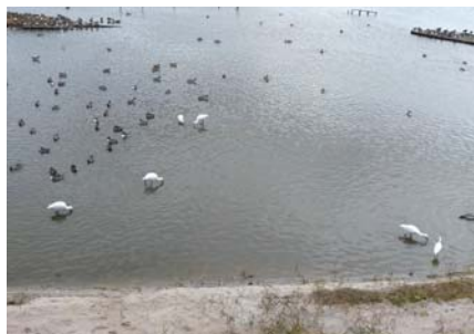
ネイチャーセンター前で採食するヘラサギとコサギ（右下）

ました。コサギの行動を注視したところ、ヘラサギがくちばしを水に浸けながら、頭を左右に振って歩き回っている横で、頻りに獲物を捕らえて食べていました。どうやらコサギは、ヘラサギが獲物を探している時に、ヘラサギに驚いて逃げる獲物を捕らえて食べているようでした。一方ヘラサギは、コサギが付きまとい自分の周りで獲物を捕っていても気にならないようでした。 他の鳥の行動を利用して獲物を捕るコサギの賢さに、あらためて感心した出来事でした。