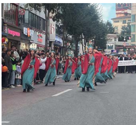
雪嶽(ソラク)文化祭のパレードに参加するがいなCONメンバー