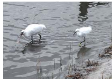
ヘラサギの後をついて歩くコサギ（右）