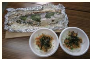
昨年の「中海の恵みを味わおう会!」で作ったスズキとアサリの料理

今年は「米子水鳥公園・野鳥の正面顔総選挙」と、「中海の恵みを味わおう会!」のイベントのほか、毎月活動しているクラブ活動である「子どもラムサールクラブ」と「米子市こどもエコクラブ」の2月の活動も、記念イベントとして開催予定です。