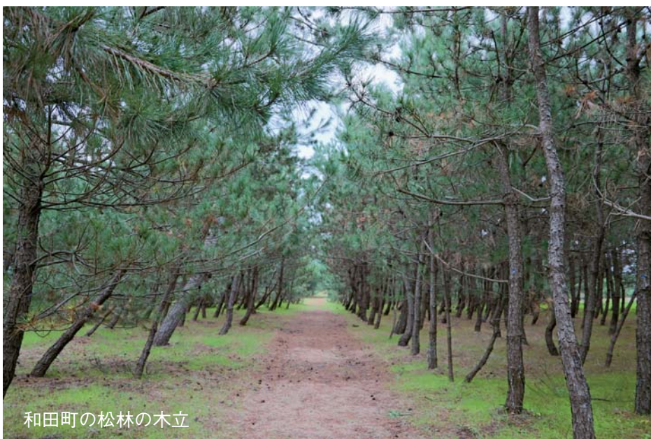
和田町の松林の木立

雪から10年の節目である今年、地域住民の皆さんのこれまでの活動の歩みや今後の展望、そして美しい松林を次世代へ残そうとする思いを紹介します。