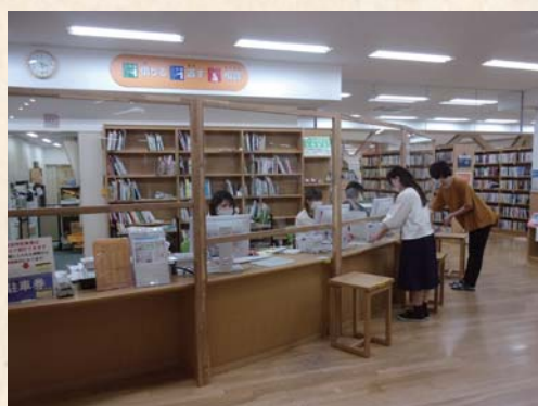
▲1階総合カウンターに設置された沫感染防止アクリル板