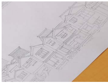
鉛筆でしつかりスケッチをしてからペンを入れる