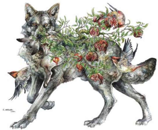
《次の種》2020年 水彩、ペン、紙