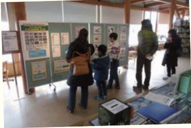
昨年開催した「米子水鳥公園カモ総選挙」

きわめて認知度が低いこの記念日を、多くの方知ってもらうため、米子水鳥公園では毎年記念イベントを開催しています。2月2日が休日とは限らないのでこの日にこだわらず、2月に開催する湿地に関するイベントを