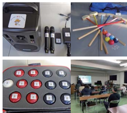
〇 地域振興課 (☎ 23-5371)

自治総合センターの宝くじ社会貢献広報事業の助成を受け、コミュニティ活動を促進するため、三本松一区自治会に備品が整備されました。三本松一区自治会ではこれらの備品を季節の行事やレクリエーションに活用し、楽しく活気ある地域づくりを行っていきます。