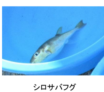
シロサバフグ (別名:金ブク)