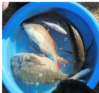
タイもかかりました