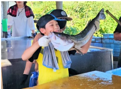
この日一番の大物・スズキ