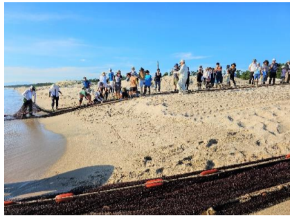
力を合わせて網を引く