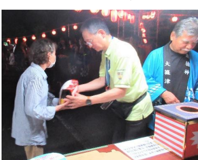
抽選会も盛り上がりました