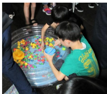
子どもたちに大人気の スーパーボールすくい