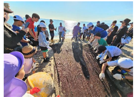
網の終わりが見えてきた