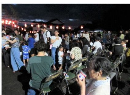
休憩用のイスも満員

地引網での見守りや納涼大会の準備・片付けなど、事故なく円滑に開催できたのは、ご協力くださった皆さまのご尽力の賜物と感謝申し上げます。