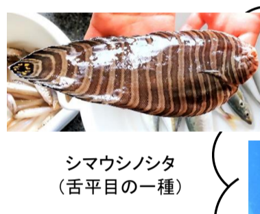
シマウシノシタ (舌平目的一种)