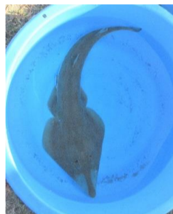
サカタザメという名前のエイの仲間