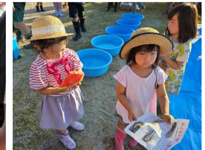
待ち時間の冷たいスイカ