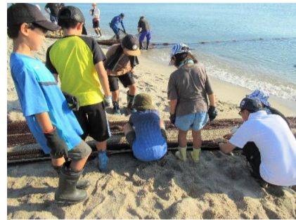
網の途中にも魚の姿がちらほら