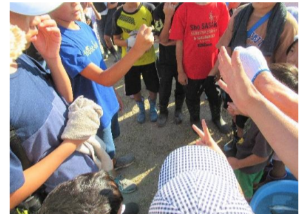
大きい魚争奪じゃんけん大会