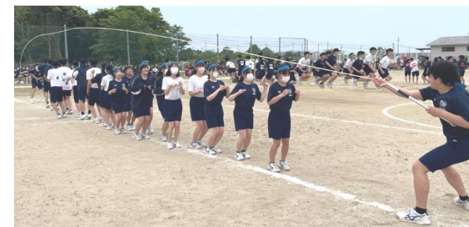
生徒会種目 Rei! Wa! Jump! (大縄跳び)