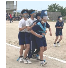
2年 爆速トコトコ列車