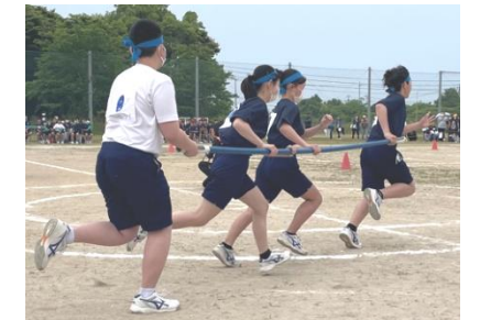
3年 棒っと生きてんじゃねえよ!