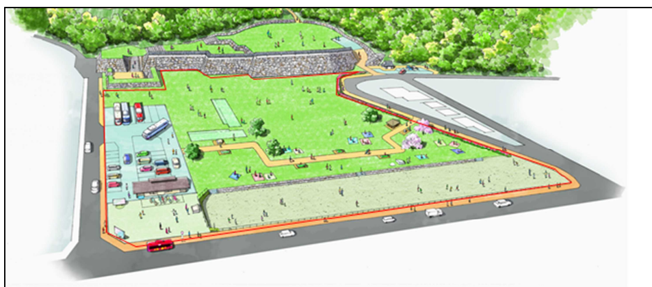
三の丸広場整備完成イメージ図