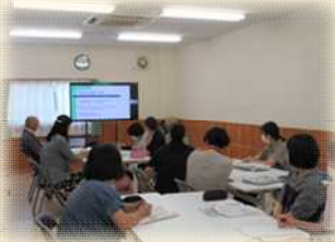
えんしょうがっこうどうどうけんしゅう 3園・3小学校合同研修