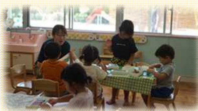
しょうがっこうぜんしよくいんほいくさんかんほいくたいけん 小学校全職員による保育参観・保育体験