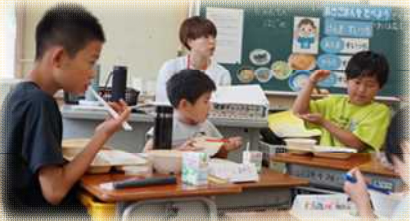
えんじしょうがくせいこうりゅう 園児と小学生の交流