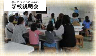
がっこうせつめいかい 学校説明会