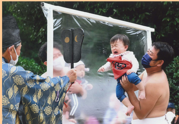
2022年度最優秀賞「涙の勝利」

詳しくは、米子市 HP ( https://www.city.yonago.lg.jp ) をご覧ください。