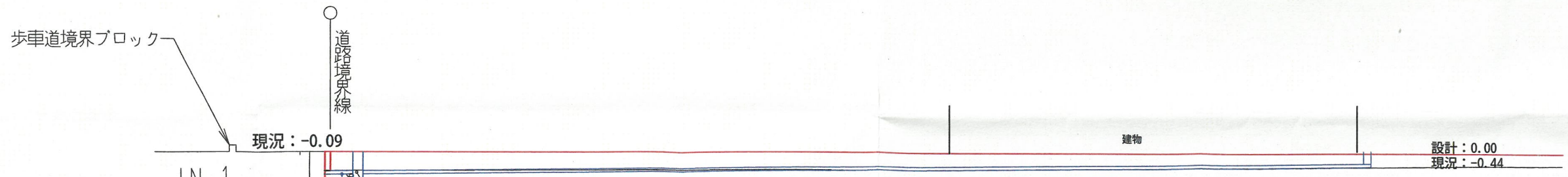
B 断面図 S:1/150