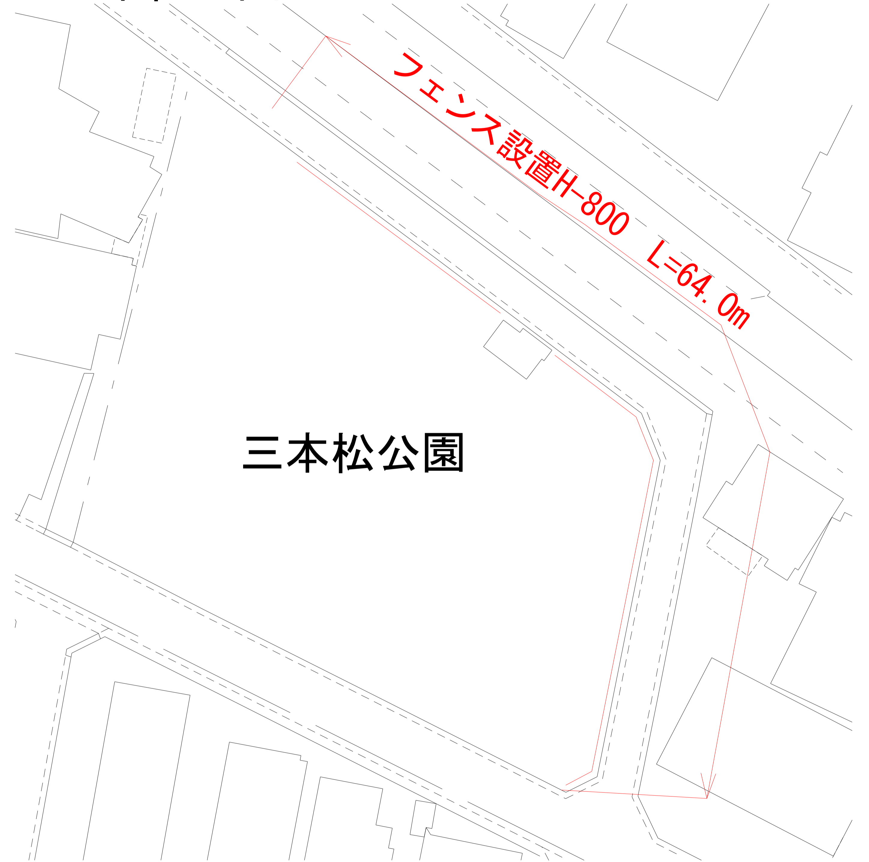
立町北公園・三本松公園