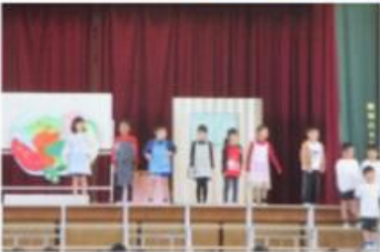
地域の皆様からの温かい励ましや声援は、子ども達の大きな力となりました。ありがとうございました。