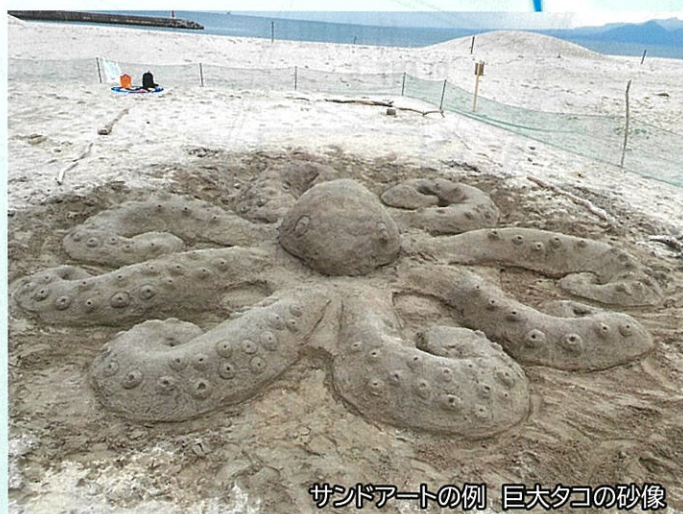
サンドアートの例 巨大タコの砂像