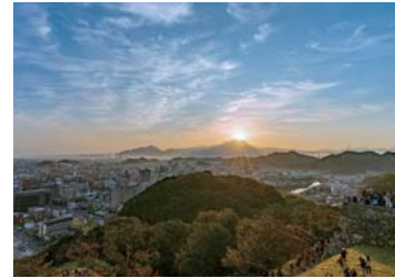
米子城跡から見るダイヤモンド大山 （令和4年10月）