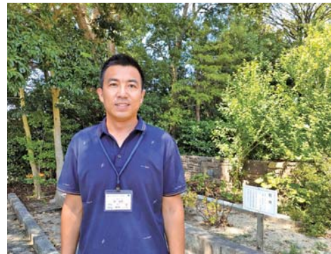
33年前に保定市との友好都市締結記念で植えられた牡丹の前で（市役所本庁舎前）