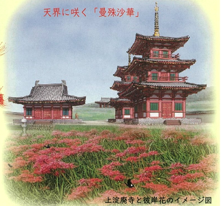
上淀廃寺と彼岸花のイメージ図