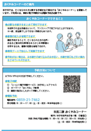
▲おくやみコーナー の案内