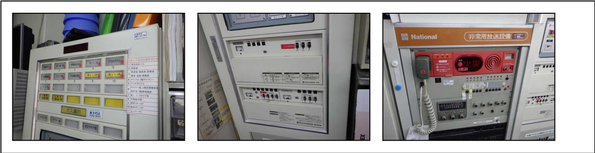
【事務室内 放送設備ユニット・自火報受信機等】