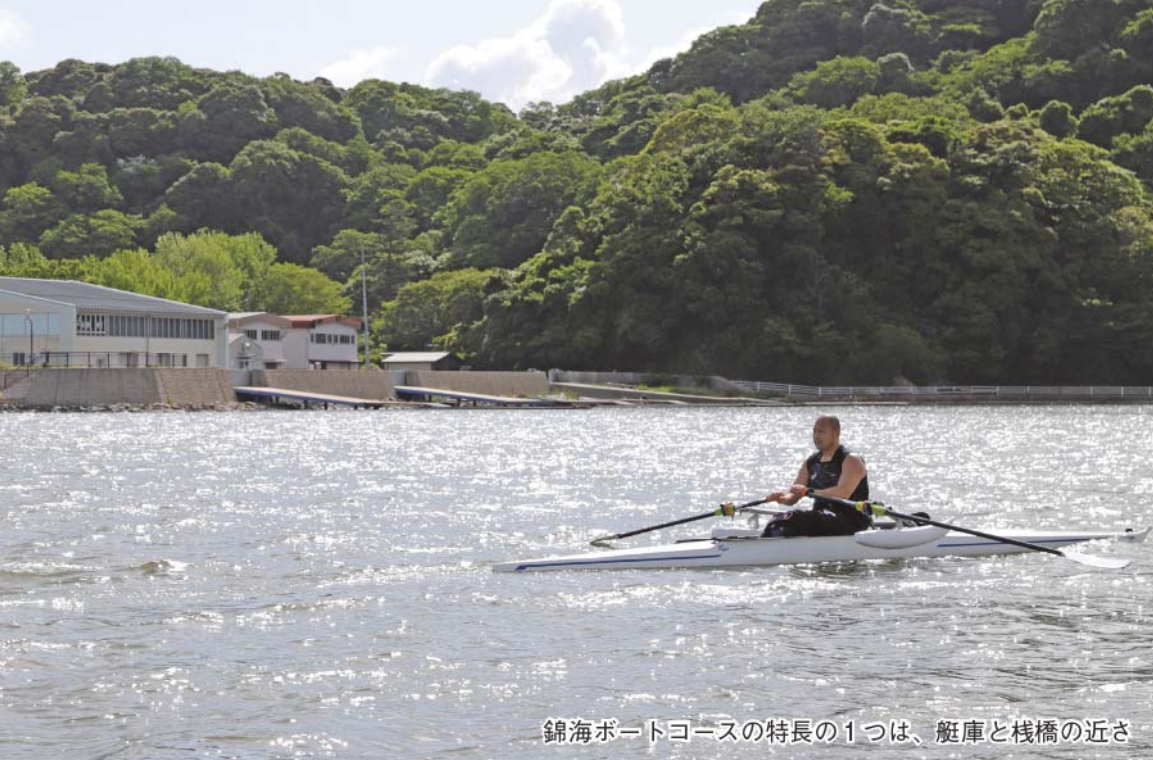
錦海ボートコースの特長の1つは、艇庫と栈橋の近さ