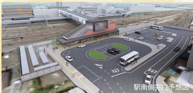
駅南側完成予想図

このたび整備される駅南側の広場「駅南広場」には、駐車場や駐輪場、タクシーの待機場・乗降場などが備わります。駅南駐車場・駐輪場は24時間利用できます。 ※駅南駐輪場・ロータリーは7月29日から、駅南駐車場は7月30日から利用開始します。