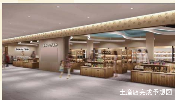
土産店完成予想図

7月29日の開通日当日は記念式典を実施します。また、地ビールフェスタなどのイベントを駅南・北広場の両方で同時開催するほか、だんだんバスの無料運行を実施します。（くわしくは7月号でお知らせします）