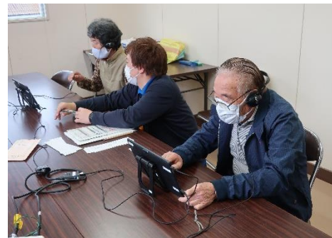
もの忘れタッチパネル