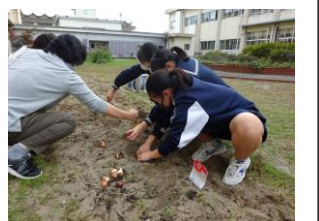
生徒会環境委員会による チューリップの球根植え

○この項に関して、ご意見、ご質問などがございましたら、28-9314(弓ヶ浜中学校)までお電話ください。Eメールは yumiga-j@mailk.torikyo.ed.jp へお願いします。