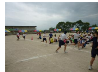
学級対抗全員リレー