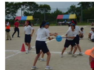
2年 ボール運びリレー