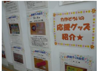
クラス応援グッズ紹介

9月4日(金)に、弓中体育祭を開催いたしました。前日までは、残暑厳しい中での準備や練習でしたが、当日は気温が下がり心地よいそよ風が時折吹くコンディションで、競技をする子どもたちもご観覧されました保護者の皆様も過ごしやすかったのではと安心しました。今年は感染症対策により各学年とも種目を絞り、競技内容も工夫して半日開催としました。全校生徒が集まってイベントを開催できたのは、今回の体育祭が初めてでした。もちろん保護者の皆様をご案内しての行事は、3月の臨時休校以降、卒業式、入学式を除いては初めてです。