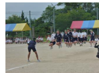
全校大縄ジャンプ