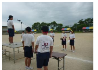
閉会式ではクラスをこえて祝福の温かい拍手が…。