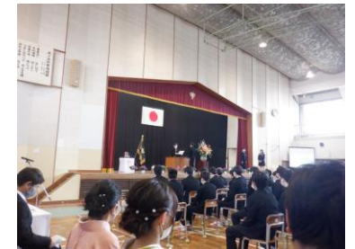
一人一人に手渡す卒業証書