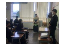
クラスみんなに語る思い

○この項に関して、ご意見、ご質問などがございましたら、28-9314(弓ヶ浜中学校)までお電話ください。