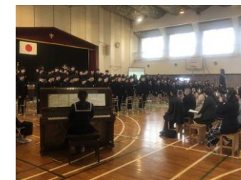
仲間と歌う卒業合唱「桜ノ雨」