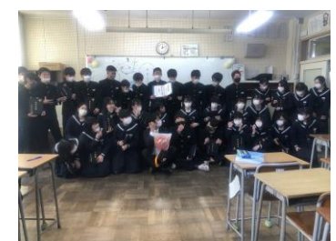
メモリアルクラス写真

Eメールは yumiga-j@mailk.torikyo.ed.jp へお願いします。