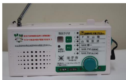
(高さ 98.5mm×幅 200mm×奥行 56mm)