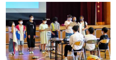
各校での取り組みを発表し合って学び合う

6月18日（金）の放課後、弓ヶ浜中の生徒会執行部生徒と弓ヶ浜小、彦名小の児童代表が、弓ヶ浜小の体育館に集まり、「弓ヶ浜中校区小中リーダー研」を行いました。会の中では、みんなが安心して楽しい学校生活をおくることができる校区をめざして、合同で行っている「あいさつ運動」等について課題を共有し、解決策を話し合いました。会を追うごとに意見を引き出す司会の力量も上がり、発言の内容にも深まりが見られました。今後は、心が温かくなる「言葉のキャンペーン」等についても取り組んで参ります。