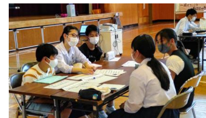
グループに分かれて課題や解決策を話し合う

6月18日（金）の放課後、弓ヶ浜中の生徒会執行部生徒と弓ヶ浜小、彦名小の児童代表が、弓ヶ浜小の体育館に集まり、「弓ヶ浜中校区小中リーダー研」を行いました。会の中では、みんなが安心して楽しい学校生活をおくることができる校区をめざして、合同で行っている「あいさつ運動」等について課題を共有し、解決策を話し合いました。会を追うごとに意見を引き出す司会の力量も上がり、発言の内容にも深まりが見られました。今後は、心が温かくなる「言葉のキャンペーン」等についても取り組んで参ります。