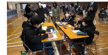
熱心なグループ討議

○中央代表委員会 ○生活委員会 ○文化委員会 ○環境委員会 ○給食委員会 ○体育委員会 ○広報活動委員会 ○他の課題委員会 以上8つの委員会にわかれて話し合いました。