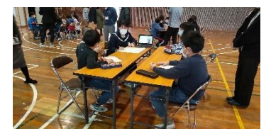
熱心なグループ討議