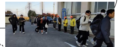
寒い冬の朝にも、地域の育成会の方々による

○この項に関して、ご意見、ご質問などがございましたら、28-9314(弓ヶ浜中学校)までお電話ください。