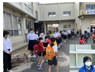
小中合同でのあいさつ運動

具体的な活動としては、はじめは、今までやってきていた学校と地域の協働活動を整理していき、支援や参画ができる活動の洗い出しを行います。生徒を見守り、育てるネットワークをつくります。また、委員の皆様には、年間を通して運営協議会や学校行事の際に、授業や行事、小中リーダー研など生徒たちが活動している姿を直に見ていただきます。そして地道に足元を固めながらつながり、息の長い運営をめざします。学校と地域がWinWinの関係を築いていくことが大切だと考えます。