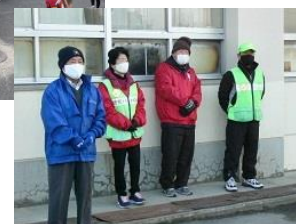
地域の育成会の方々によるあいさつ運動