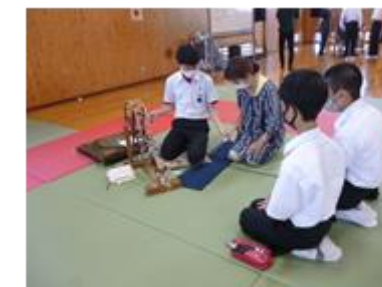
郷土学習での弓浜餅体験