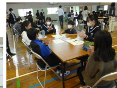
小中リーダー研での意見交換 小学生と中学生の話し合い活動をご覧いただけます