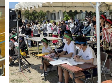
学校行事(体育祭)などでは地域の交通安全協会の方々にご案内いただきました

○この項に関して、ご意見、ご質問などがございましたら、28-9314(弓ヶ浜中学校)までお電話ください。Eメールは yumiga-j@mailk.torikyo.ed.jp へお願いします。