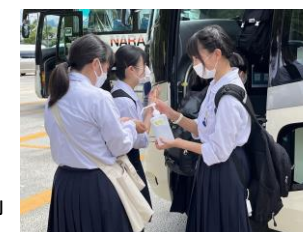
シシュでこまめに感染症対策

今年に入って、国の感染症対策がウイルス変異に伴う感染状況の変化から「自粛や制限を加えた対策」ではなく「自己及び施設予防の感染対策を徹底して