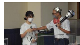
お宿で大学年レク大会