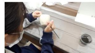
京焼体験で湯呑に絵付けをして焼きあがったら弓中に届きます