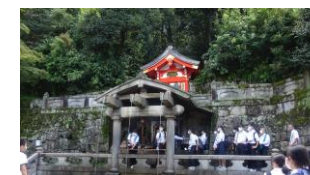
音羽の滝でお願い