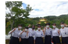
金閣寺をバックに