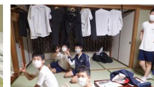
お部屋でのくつろぎ