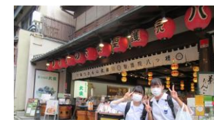
清水坂で京土産のお買い物

○この項に関して、ご意見、ご質問などがございましたら、28-9314(弓ヶ浜中学校)までお電話ください。Eメールは yumiga-j@mailk.torikyo.ed.jp へお願いします。