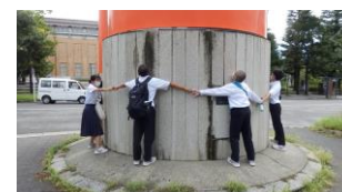
平安神宮の大鳥居を実感して