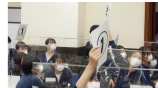
部屋別対抗クイズ