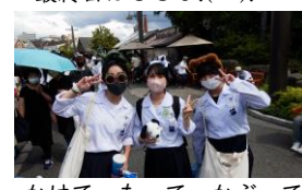
かけて、もって、かぶって