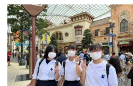
アトラクション&お買い物