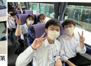
騒がず、でも楽しくバス旅行