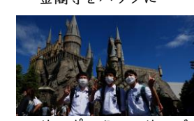
ハリーポッターエリアで