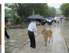
雨と鹿に迎えられ

今年度は「2泊3日」の関西方面の修学旅行に戻りました。やり方を工夫しながら、事前のご家庭の協力により、出発してから帰るまで大きな体調不良もなく無事に活動、戻ってからの3日間の健康観察期間もクリア、現在通常の活動に戻りました。改めてご家庭の感染症対策に感謝申し上げます。